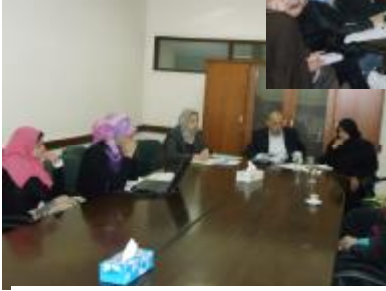
نماذج لبعض اجتماعات فرق المشروعات المقبولة مبدئياً

في إطار تقييم مقترحات مشروعات المشاركة الطلابية في مجال ضمان الجودة QASP - الدورة الثانية والتي تم فتح باب التقدم لها حتى ٢٠١١/٧/٢٨ (بلغ عدد المقترحات التي تقدمت للتمويل خلال هذه الدورة ٦٢ مقترحاً)، فقد قامت إدارة البرنامج بعقد ورشة تحكيم بمشاركة ٦ من السادة الخبراء من مختلف الجامعات المصرية ومختلف التخصصات العلمية والنظرية بالإضافة إلى رؤساء مجموعات الدعم الفني والمتابعة والتقييم بالبرنامج وخبراء المتابعة خلال الفترة من ٢٨ سبتمبر إلى ٤ أكتوبر ٢٠١١ وتم القبول المبدئي لعدد ٢٨ مقترح.