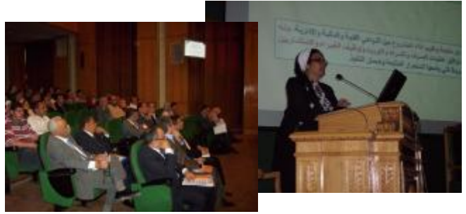
ورشة عمل توزيع عقود لمشروعات التنافسية- الدورة الثالثة